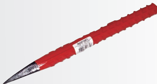
Aço corrugado CA-50 Pintura esmalte vermelho/preto

Haste de amortecedor cromada Pintura esmalte vermelho