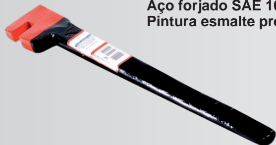
Aço forjado SAE 1045 Pintura esmalte preto/vermelho