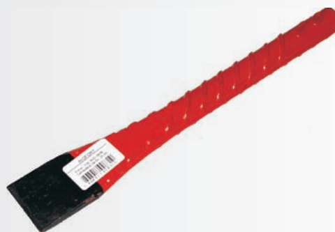
Aço corrugado CA-50 Pintura esmalte vermelho/preto

Haste de amortecedor cromada Pintura esmalte vermelho