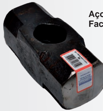
Aço forjado SAE 1045 Faces polidas