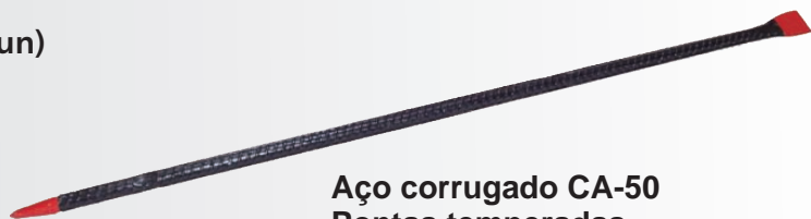
Aço corrugado CA-50 Pontas temperadas Pintura esmalte preto/vermelho