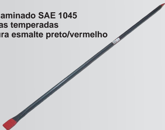
Aço laminado SAE 1045 Pontas temperadas Pintura esmalte preto/vermelho