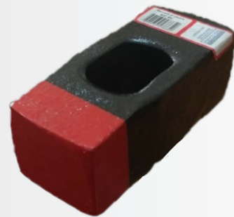
Aço forjado SAE 1070 Pintura esmalte preto/vermelho

Aço forjado SAE 1045 Pintura esmalte preto Cabo de madeira envernizado Fixação com cabo epóxi