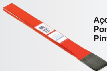
Aço laminado SAE 1045 Ponta polida Pintura esmalte vermelho