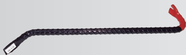
Aço corrugado CA-50 Pintura esmalte preto/vermelho