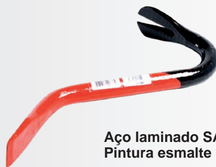
Aço laminado SAE 1045 Pintura esmalte vermelho