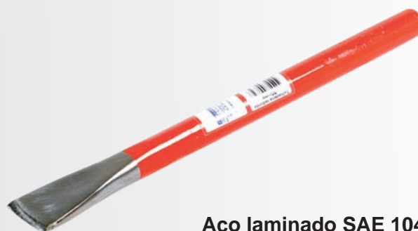
Aço laminado SAE 1045 Ponta polida Pintura esmalte vermelho