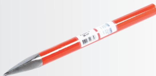
Aço laminado SAE 1045 Ponta polida Pintura esmalte vermelho